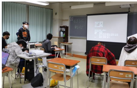
2年生教室会場の様子。ユーモアのある内容で、盛り上がったようです。

10月21日(木)に全校レクリエーション(映画鑑賞)を行いました。今年度は「あの日見た花の名前を僕達はまだ知らない」と「るろうに剣心」の2作品のうち、生徒は希望の作品を鑑賞し、各々が感想を記入しました。