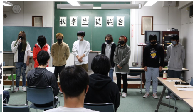
総会に先立って、新生徒会役員の紹介がありました。

10月28日(木)の3校時に本校視聴覚室にて、令和3年度秋季生徒総会が行われました。新生徒会役員が組織されて初めての総会であり、主に行事報告や予算の中間審議を行いました。