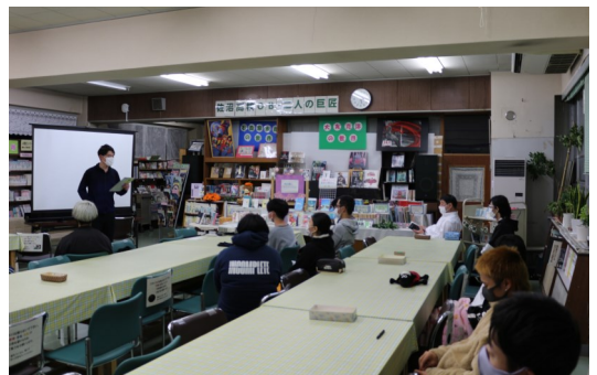
図書室会場の様子。感動的な内容であったこともあり、鑑賞後に涙する生徒もいました。

年に1度のレクリエーション行事ということもあり、生徒は皆当日を楽しみにしていた様子で、上映が始まると集中して鑑賞していました。鑑賞後の感想には「感動した」「泣いてしまった」「おもしろくて笑ってしまった」等の様々な感想を書いていました。帰り際に「次も楽しみにしています」と言って帰った生徒もおり、とても充実した行事になったようです。