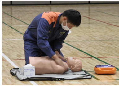
講師の方によるAED講習の様子。丁寧に解説していただきました。

10月14日(木)の3・4校時に第2回防災避難訓練を実施しました。最初に洪水等の水害を想定した垂直避難訓練を行い、生徒は授業を受ける教室から校舎4階や第2体育館2階