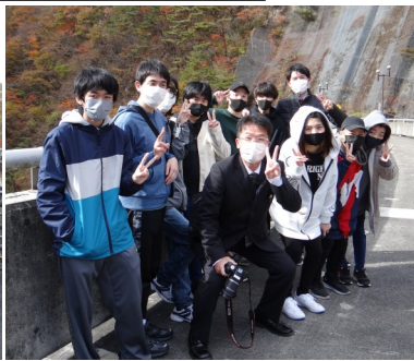
鳴子ダム自由見学中の2年生の様子

当日は天候にも恵まれ、紅葉真っ盛りと絶好の見学日和となりました。鳴子ダムより、鳴子温泉駅、鳴子峡、あ・ら・伊達な道の駅の順で見学をしました。一人一人がマナーや時間を守り、行程通りに巡ることができました。夕方から登校する普段の学校生活とは異なり、朝から夕方までの1日行事となりましたが、全行程が終了し解散する際の生徒の表情には充実感が見られました。地元宮城県を代表する観光地に足を運び、様々なことを感じた進路見学会での経験は、生徒にとって充実した1日となりました。