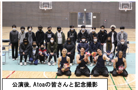
公演後、Atoaの皆さんと記念撮影