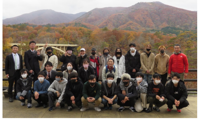
「紅葉日本一」を誇る鳴子峡での集合写真 見事な紅葉を満喫することができました！