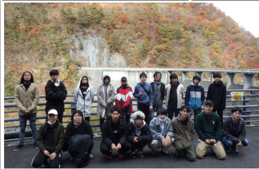
「日本初のアーチ式ダム」である鳴子ダムでの集合写真。放水の様子は迫力満点でした！