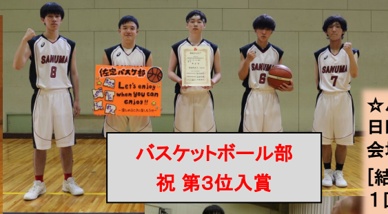
バスケットボール部 祝 第3位入賞

☆バスケットボール部 日時:6月19日(土) 20日(日) 会場:仙台市若林体育館 [結果] 1回戦 佐沼 65-22 大河原商業 準決勝 佐沼 17-68 貞山 3位決定戦 佐沼 40-31 名取