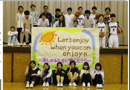
大会前日[18日(金)]に行われた 壮行式での全校生徒集合写真

6月19日(土), 20日(日), 26日(土)に, 本校のバスケットボール部, バドミントン部, 陸上部の生徒たちが種目ごとに各会場にて, 第66回宮城県高等学校定時制通信制体育大会に出場しました。各種目において最後まで諦めず健闘してきましたので, その様子を結果とともにお届けします。